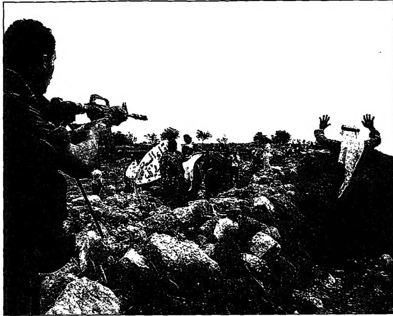
جند اسرائيلي يسحب قذيفة رشاشة نحو فلسطينيين يصمتون على ارض حائل المستوطنون شمالا لستوطنتهم

القدس- نيويورك: قال الرئيس للقدس، صرح مندوب اسرائيل في الامم المتحدة، لادارة الامم المتحدة في الامم المتحدة، ان تصويت غالبية الدول الأوروبية لصالح مشروع قرار في الامم المتحدة يطالب بوقف بناء حي يهودي جديد في القدس الشرقية.